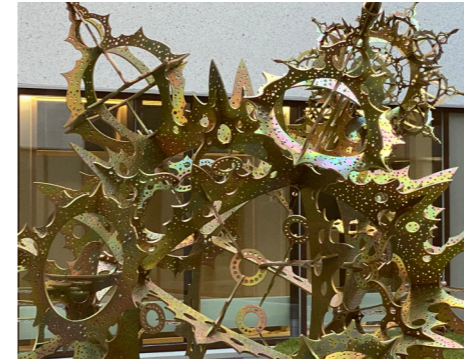
Stjärnan på en av innergårdarna i Finspångs nya Vårdcentrum av Christian Partos

På parkeringsplatserna för verksamhetens tjänstebilar finns laddningsstolpar för elbilar.