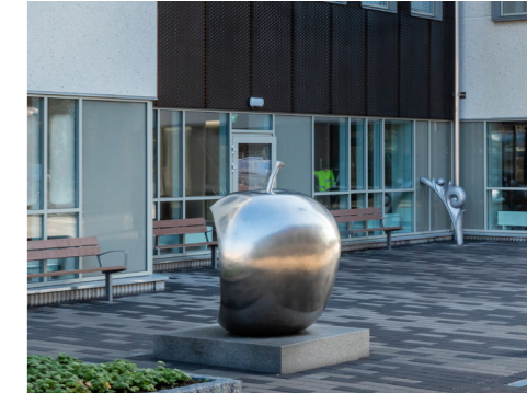
Äpplet av Bigert & Bergström