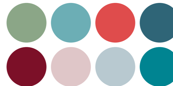
Ett urval interiörfärger.