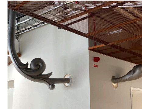
Sissi Westerbergs skulptur, Ornamentum Petentibus, växer genom väggar och tak i entrén